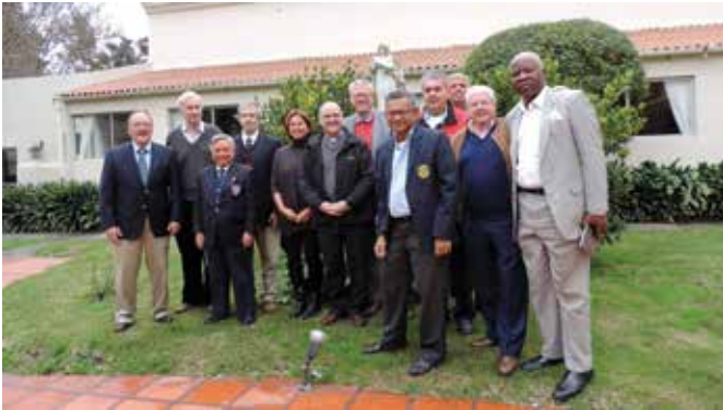
El Consejo de la Unión mundial con el Provincial de Argentina-Uruguay

La Unión Mundial de Antiguos Alumnos de Jesuitas (WUJA) reúne a los antiguos alumnos o estudiantes de las escuelas y universidades jesuitas del mundo entero, con el fin de construir las relaciones internacionales entre estas personas, de contribuir a la misión de la Compañía de Jesús y de promover la dinámica universal de la enseñanza jesuita.