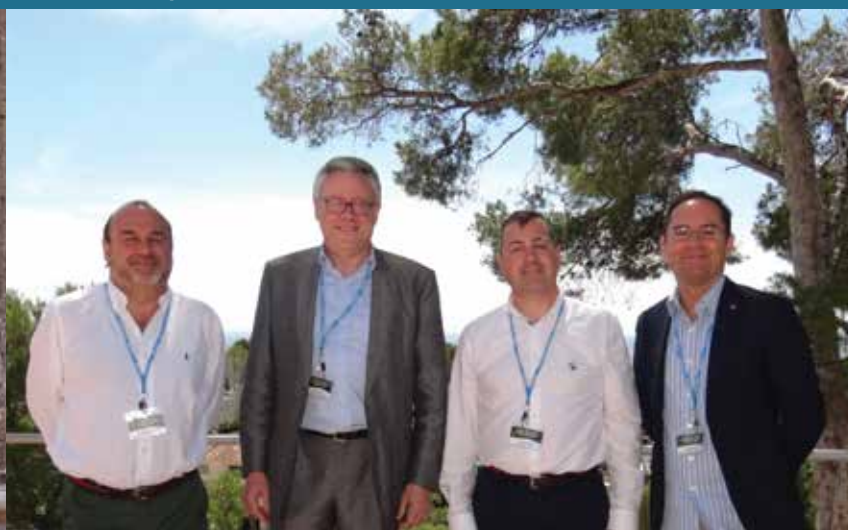
Federación, Unión Mundial, Asociación y Confederación