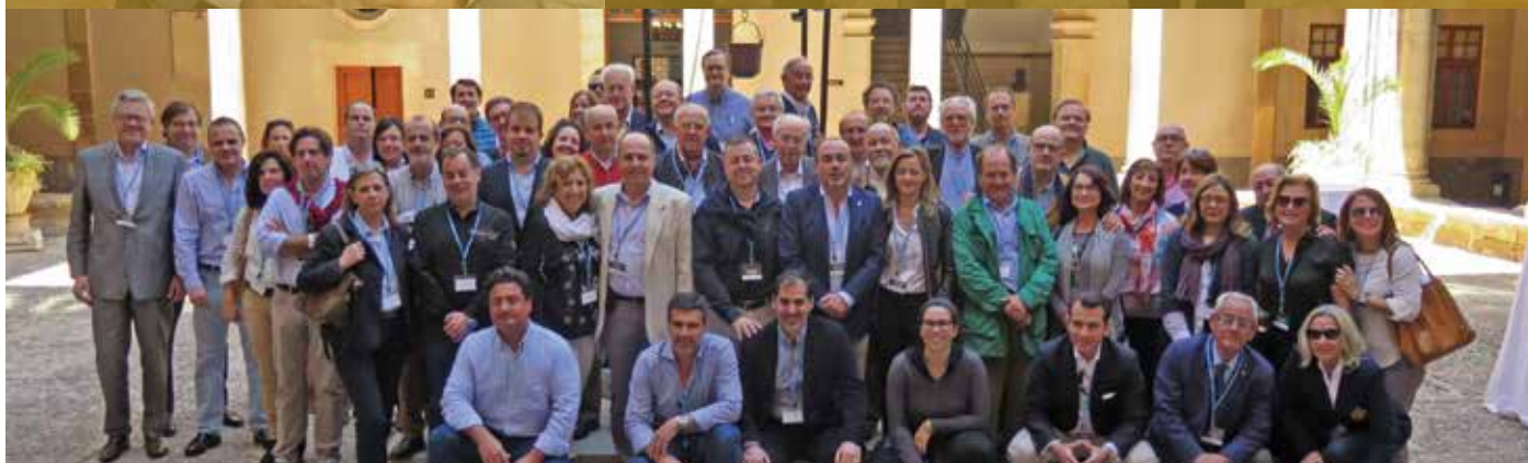
X Congreso Nacional de Antiguos Alumnos de Jesuitas