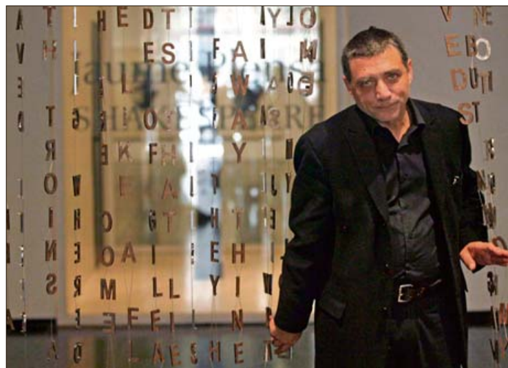
Jaume Plensa, junto a una de sus obras.