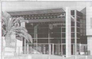
Nueva entrada del Colegio Son Moix y Pabellón