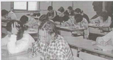
Alumnos de FP en plena tarea.