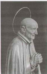
San Alonso Rodríguez, O.S.A.

Su entrega abnegada y mortificada, vivida con y por amor, echó una ráfaga de luz relativadora de nuestras necesidades materiales, que se nos antojan