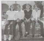
No cabe duda de que el curso ha empezado bien