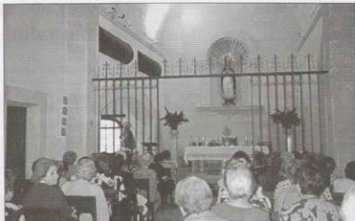
En octubre, una de nuestras visitas culturales fue al Convento de Religiosas Asuncionistas de Sineu.