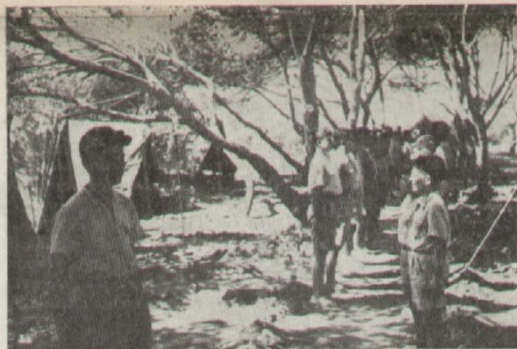
Tres instantáneas de la vida campamental...

Colegio Ntra. Sra. Montesión Palma de Mallorca