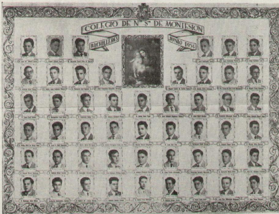
LOS NUEVOS RECLUTAS

Otra «orla». Otra promoción. Otros rostros inquisitivos que se asoman a la vida que tantas sorpresas les prepara. Otra leva de compañeros y militantes en nuestra Asociación. Bienvenidos ¡Y a triunfar en la vida, muchachos! Nosotros os ayudaremos.