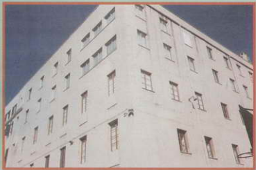
Colegio de Montesión

La obra MONTESION, esto es, la labor pastoral y educacional de la Compañía en Palma de Mallorca seguir su curso. Ojalá se pudieran agregar pronto otros jesuitas jóvenes. Esto está en las manos de Dios y Él actuará en el momento oportuno. Pero el P. General hablando de la participación de los seglares en las obras de la Compañía, dice: «Nosotros hemos necesitado un cierto tiempo para descubrir que el asumir responsabilidad —que, no el poder— de los seglares en nuestras instituciones estaba en la línea de lo que el Espíritu ha dicho a la Iglesia a través del Vaticano II. Este optimismo encuentra así su fuerza en la experiencia