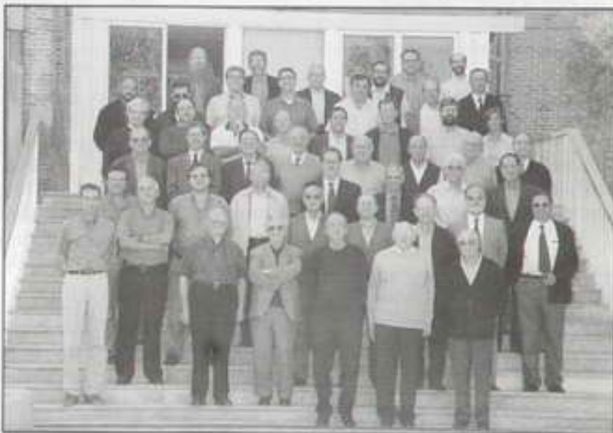
Reunión de directores de los Colegios de jesuitas de España

-Cuarenta y tantos años en el Centro por supuesto dan pie para haber recopilado anécdotas. Ex-