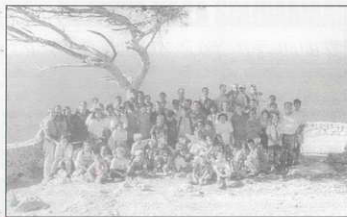
Grupo Scout San Alonso de excursión en La Trapa

con la naturaleza... lo que nos llena a los scouts; lo que realmente nos llena es la vida de nuestros niños y niñas: Ver como crecen, como maduran, ver la alegría que expresan sus rostros por poco que hagan por ellos.