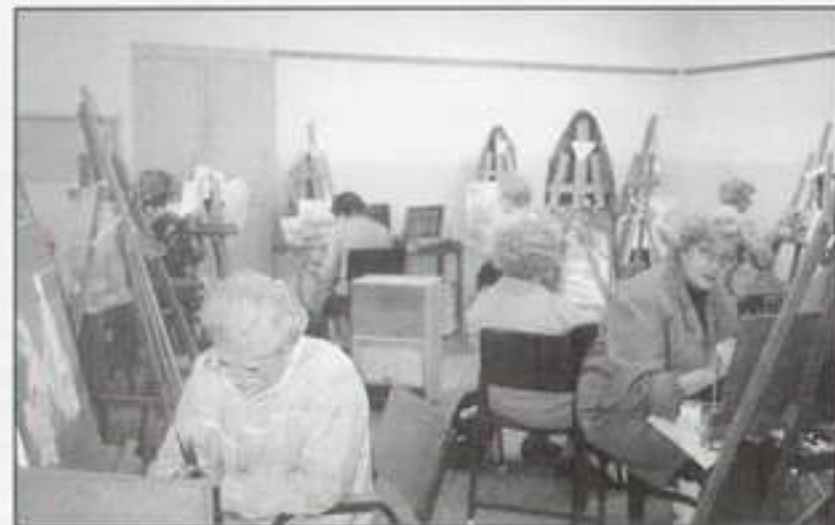
Trabajando en el Taller de Pintura al óleo

Presentaremos varias películas: «La caja de música navideña», «Un día inolvidable», y el delicioso musical. «Siete novias para siete hermanas».