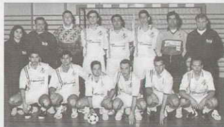
EQUIPO SENIOR. Participantes Liga Autonómica Balear.