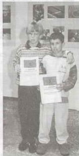
Ganadores del Concurso de Fotografía