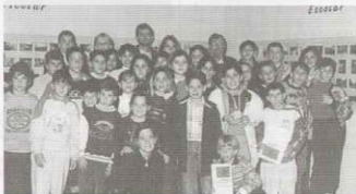
PARTICIPANTES DEL CONCURSO DE FOTOGRAFIA ESCOLA