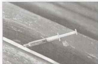
1er. Premio. Serie de tres fotos, Lorenzo Juliá 5º