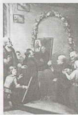
Primeros honores trabajados al Santo H. Alonso, colocando un cuadro sobre su tumba.

El 6 de Junio de 1.816 los jesuitas volvieron a ocupar el Colegio. Tomó posesión, como Superior y Rector, el P. Fran-