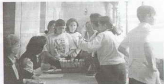
Un momento de la tradicional Gymkana Cultural