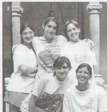
Equipo de fútbol 1º de BUP

Los profesores también disfrutaron mirando cómo jugaban sus alumnos. Total, que fue un día de los que no nos importaría repetir, bueno, nos despedimos, que desgraciadamente ya nos queda super poco para los exámenes, (aunque eso significa que pronto podremos hacer lo que nos de la gana) ¡Al fin!