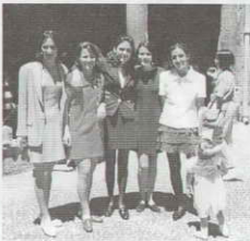
Un grupo de "Confirmadas"

No temáis ni al futuro ni al compromiso. En la vida hay que tomar partido, sin pedirle tiempo prestado. Sed críticos y celosos de vuestra libertad e intimidad. Decid vuestra verdad, cautelosamente, pero siempre la verdad. Evitad la agresividad, el rencor y la envidia, puesto que erosionan el espíritu. Huid de las vanidades. Practicad la humildad y mezclárolas con la gente, pues conocer las adversidades y los problemas de los demás, os fortalecerá y evitará que os dañen inesperadas desgracias. Disfrutad tanto de vuestras realizaciones como de vuestros sueños y proyectos. Cuidad vuestro entorno y respetad la naturaleza. Incorporad una cierta disciplina a vuestras