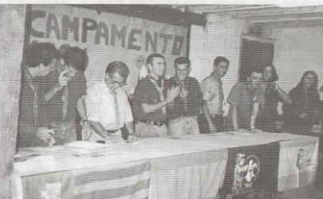
Pirineos - Sennet