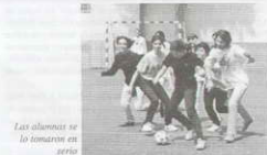
Las alumnas se lo tomaron en serio