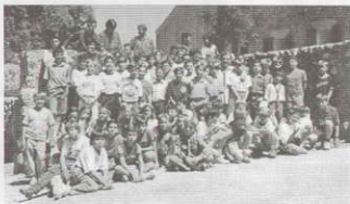
Binifaldó - Mallorca 1991

Queridos amigos, amigas, y familias. Todo está prácticamente preparado: los permisos, el lugar, Binifaldó en la sierra de Tramontana en Mallorca, y en Sennet - Pirineos centrales, en la provincia de Lérida. En nuestros Campamentos, tratamos de crear un nuevo estilo de vida y mostrándonos que vale la pena y es posible nuestra apuesta por un mundo mejor. El campamento desde su preparación es un excelente termómetro del Grupo Scout: Nos da la medida de lo que somos capaces de construir. El escultismo es acción y vida, y el campamento es un fiel exponente de ello. Tenemos ante nosotros una apasionante aventura llena de posibilidades, en la que tratamos de concretar y resumir el trabajo de todo un curso. Como en años anteriores os ofrecemos un buen número de actividades para ayudaros a animar la Fe del Campamento. La celebración de Misas, y oraciones de la mañana, y por la noche, reflexiones, veladas y fuegos de Campamento. En nuestro deseo de que os sea útil este material y que paséis un feliz campamento en el cual la animación de la Fe ocupe el lugar que todos sabemos le corresponde en nuestro Movimiento Scout Católico. Os esperamos a todos.