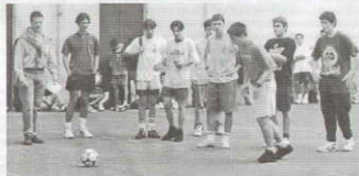
Penalty a la vista