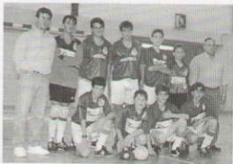
Equipo Infantil 8º de EGB

En el próximo número de la revista Montision facilitaremos todos los resultados y resumen de la temporada 95-96 que en estos momentos todavía no ha finalizado.