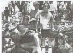
ponemos de acuerdo para llevar a cabo una buena idea. ¡Ojalá que la repitamos!

Solo queda una cosa por decir, aprendimos todos mucho de los que visitamos, pero la mejor lección fue que había valió la pena