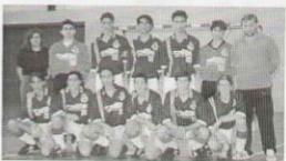
Equipo Cadete 2º de BUP