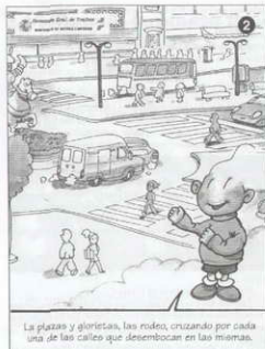
Las plazas y glorietas, las rotondas, cruzando por cada una de las calles que desembocan en las miradas.

Los alumnos de 5º hemos ido a Son Reus en autocar, mientras cantábamos canciones; el camino no ha durado mucho tiempo. Hemos llegado allí, y hemos entrado en un aula y nos hemos sentado. Había un monitor que nos explicaba cosas: Que hay