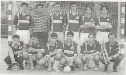
Equipo Juvenil 3º de BUP