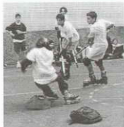
El Hockey también estuvo presente