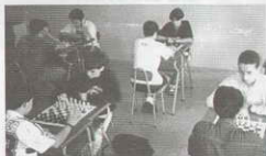
Torneo de Ajedrez