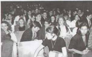
El repleto Salón de Actos del Colegio

All of the companies are given a set budget within which they have to work and their progress is closely controlled by their teachers.