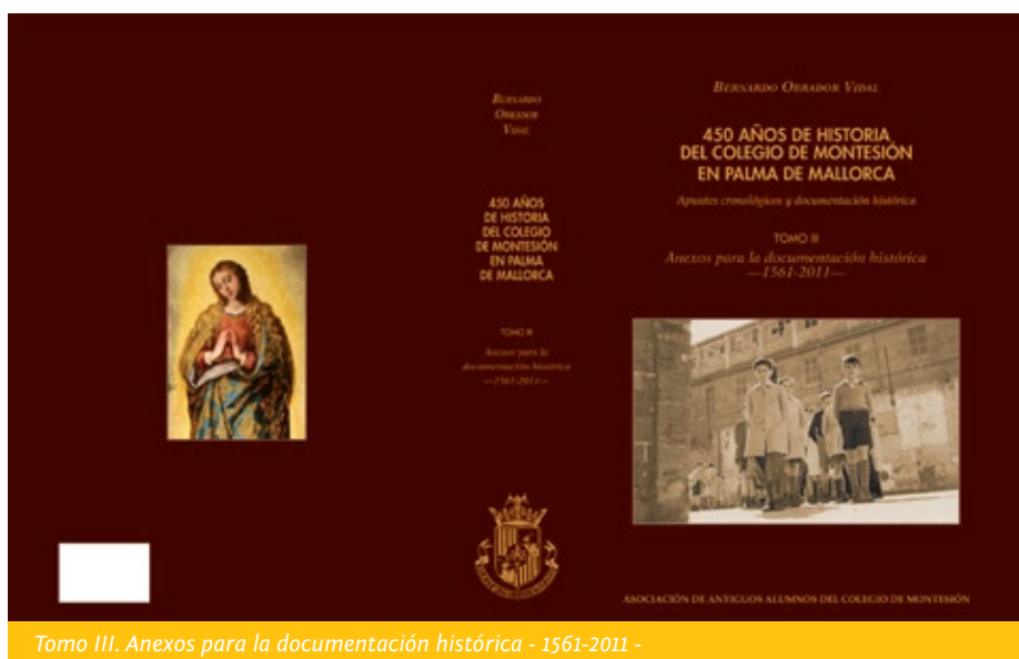
Tomo III. Anexos para la documentación histórica - 1561-2011 -