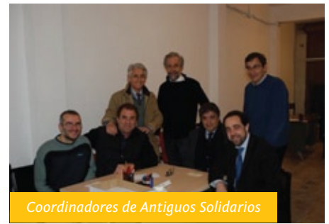
Coordinadores de Antiguos Solidarios

Aproximadamente un 70% a inmigrantes. Y el resto a la población nacional o local y dentro de ese grupo hay un porcentaje en ascenso de jóvenes y pensionistas, personas que no les alcanza a la compra de alimentos más allá de mediados de mes.