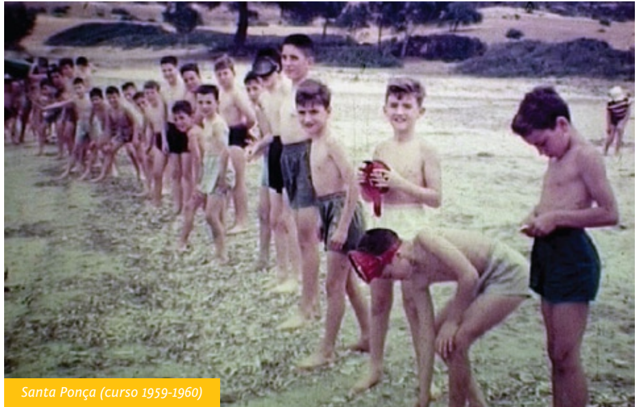
Santa Ponça (curso 1959-1960)

Calculo que en el video saldrán unos 26 testimonios en total, de los cuales media docena proceden de los archivos de la Asociación de Antiguos Alumnos, valiosísimos documentos ya que se trata de viejas glorias, ya desaparecidas. A fecha de hoy llevamos grabados 12 horas, y en total (incluyendo archivos) alrededor