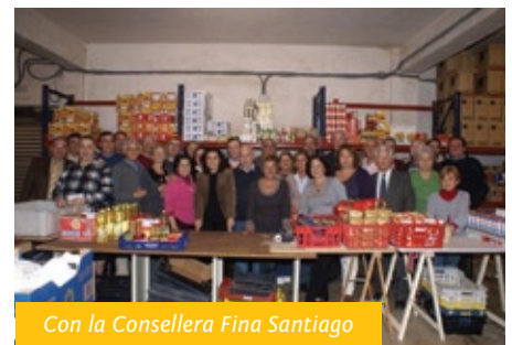
Con la Consellera Fina Santiago

Tenemos no sólo la aspiración, sino una verdadera ilusión en incorporar jóvenes estudiantes del Colegio. En el periodo vacacional veraniego y en la Campaña de Reyes han colaborado con nosotros de forma activa estudiantes tanto de Montesión como de otros centros. Este tipo de actividades favorece el crecimiento personal y humano, cultivando los valores necesarios para ir madurando como persona. El contacto con familias económicamente dependientes y con el voluntariado proporciona una visión realista de nuestra sociedad, complementando en parte la formación humana que reciben de nuestro querido Colegio de Montesión.