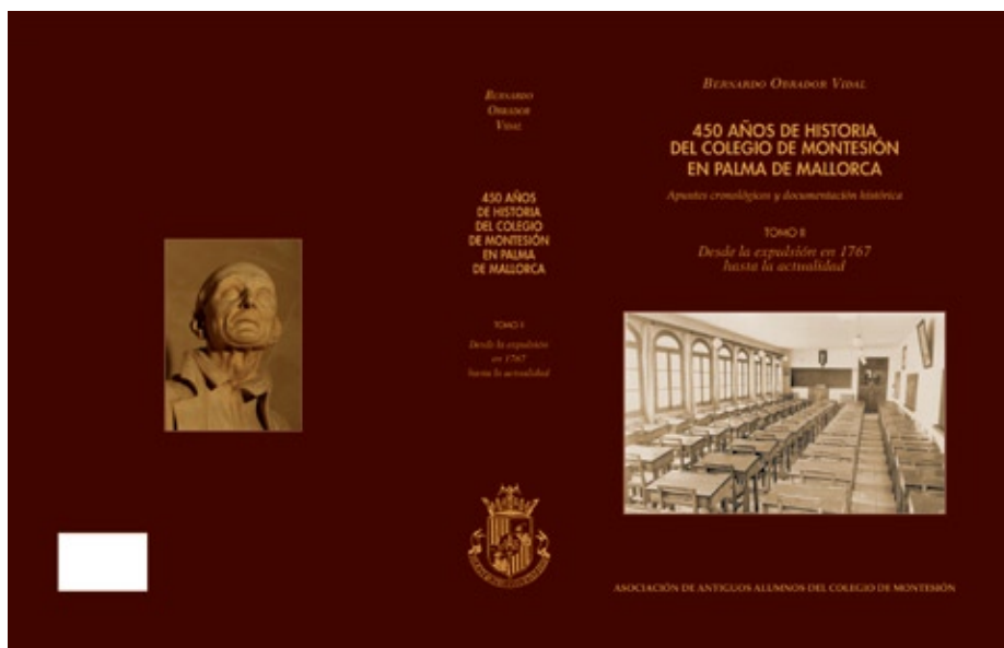
Tomo II. Desde la expulsión en 1767 hasta la actualidad