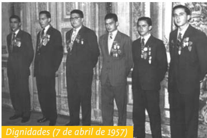
Dignidades (7 de abril de 1957)