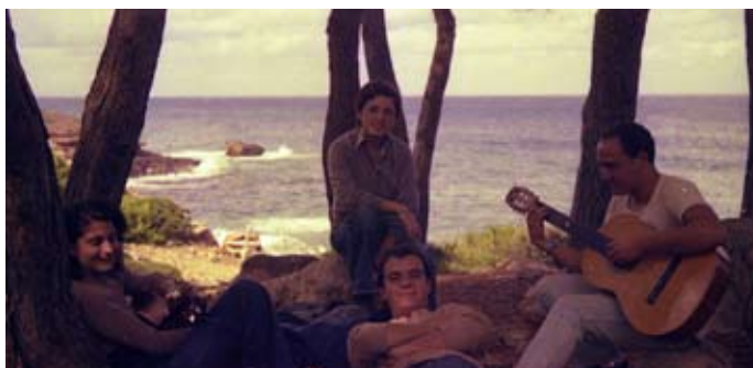
Excursión Congregación, Port del Canonge (1977)