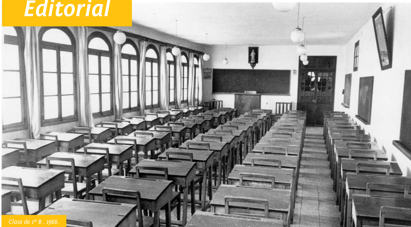
Clase de 1º B . 1968.

Venciendo las múltiples dificultades encontradas, y más aún en el momento actual, os presentamos el nº 2 de la Revista de los Antiguos Alumnos de Montesión.