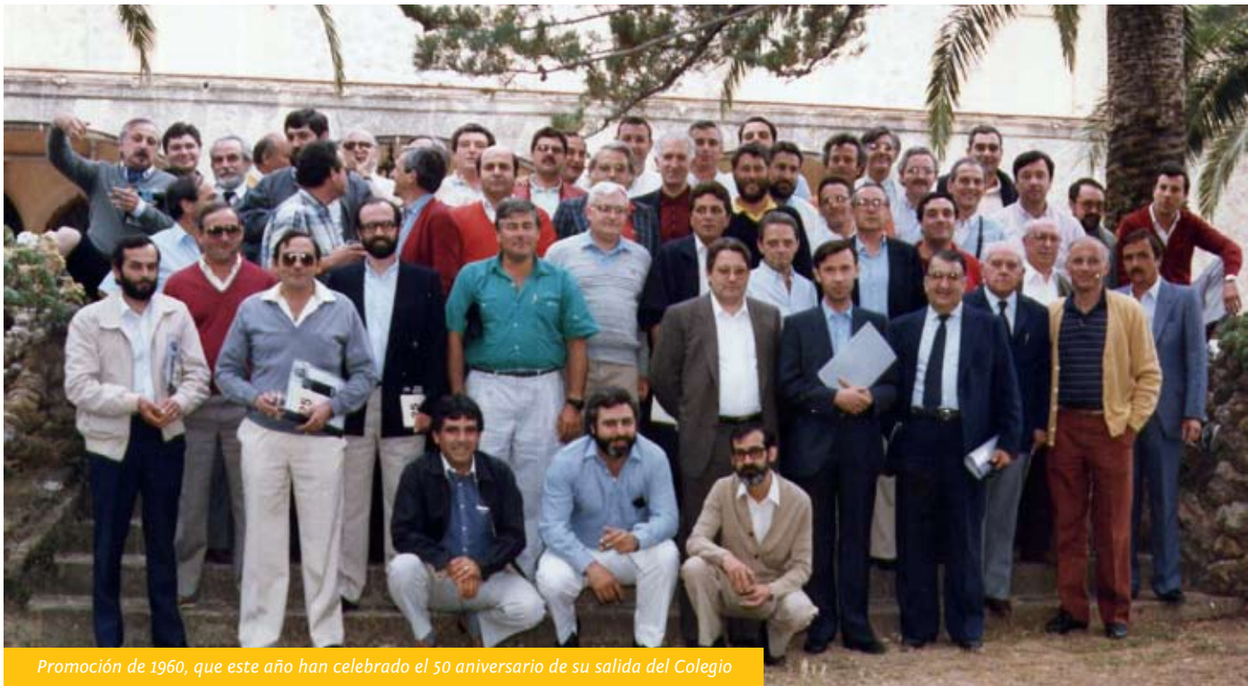
Promoción de 1960, que este año han celebrado el 50 aniversario de su salida del Colegio