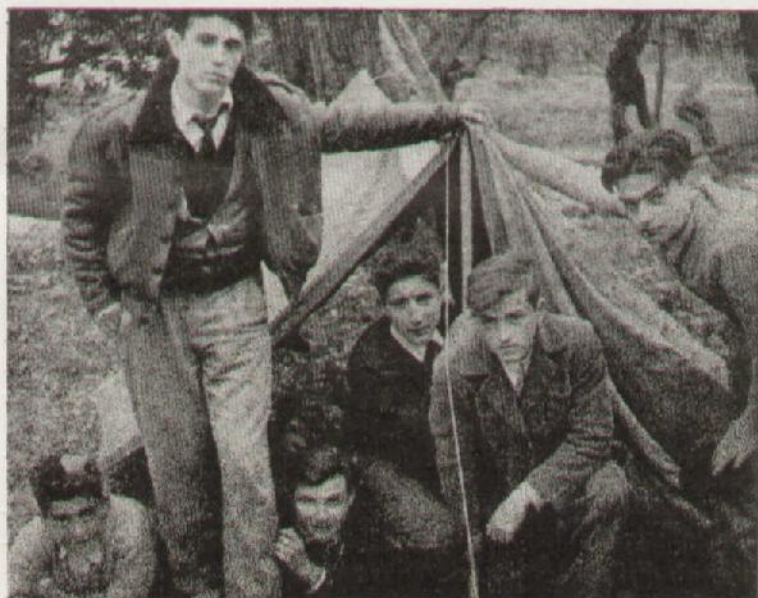
Los «Grumetes» en su tienda de campaña.

En la última Proclamación de Dignidades hicieron una muy lucida exhibición los alumnos de gimnasia del A. A. Luis Dezcallar. De ella damos una muestra gráfica.